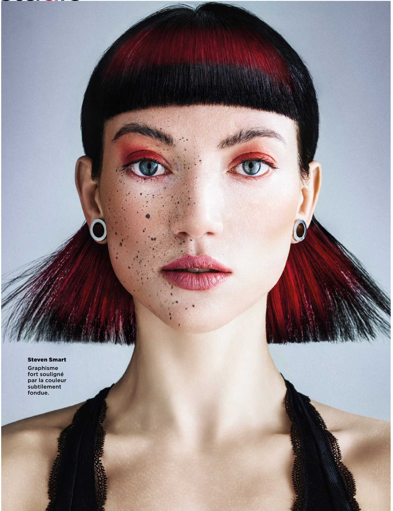
Steven Smart Graphisme fort souligné par la couleur subtilement fondue.