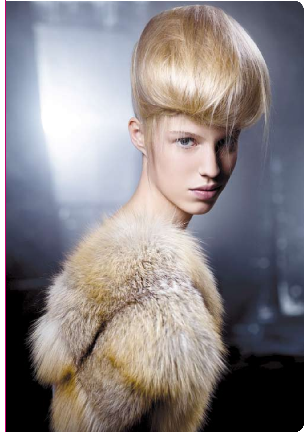
Haute Coiffure Française - Effet trompe-l'œil d'une coque réalisée à partir d'une queue-de-cheval enroulée sur crépon, sur le dessus de la tête, et joliment parsemée de fines mèches rebelles...