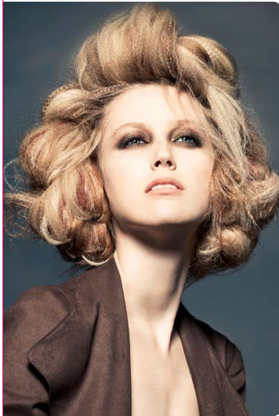
Denis Holbecq pour L'Oréal Professionnel - Jeux de volutes sur une matière finement gauffrée ou effet vaporeux de cheveux mi-bouclés mi-emmêlés pour des attaches à la fois souples et sophistiquées, tout en liberté !