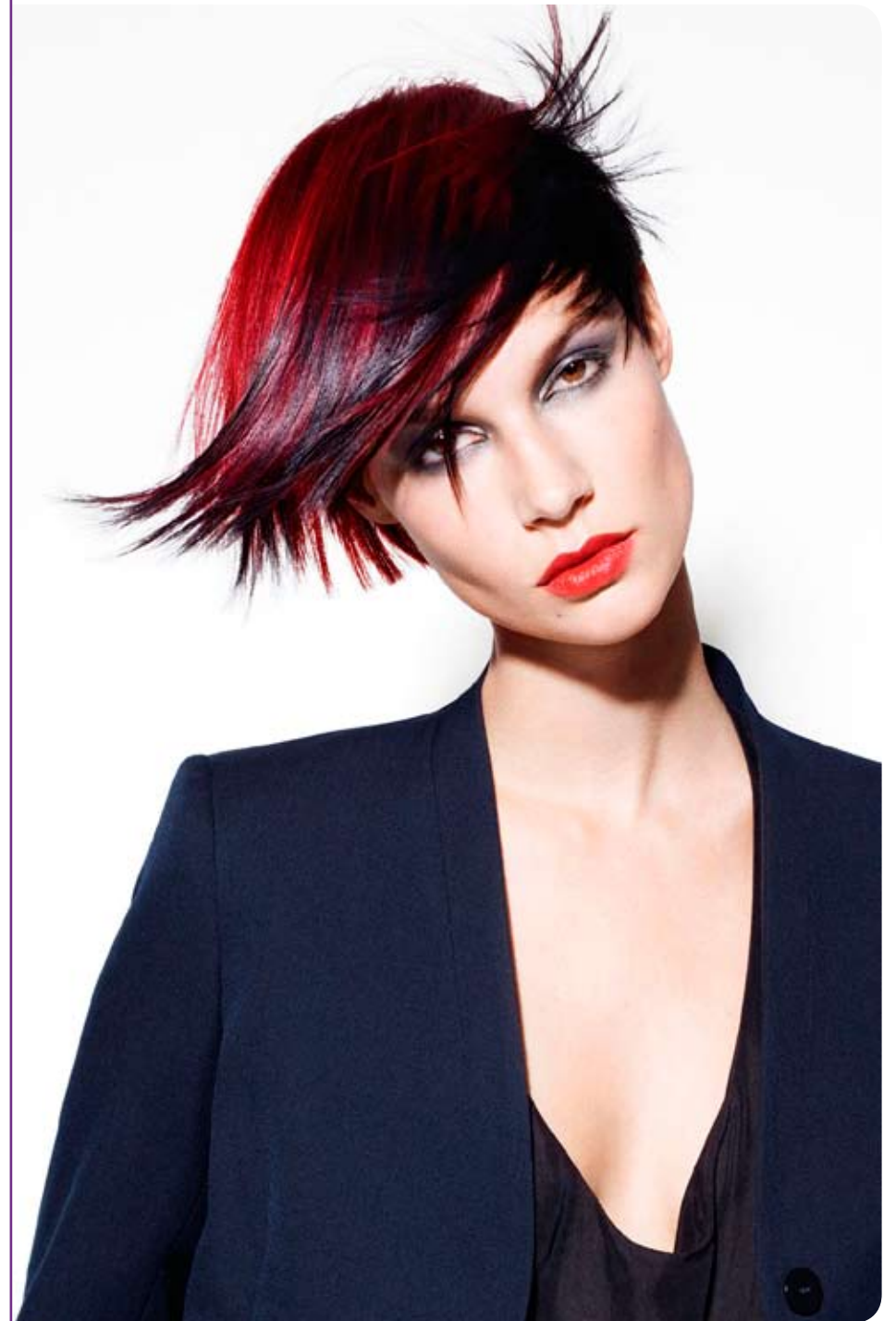
Essential Looks de Schwarzkopf Professional - Urbaine et stylée, avec cette coupe au volume complètement déséquilibré...