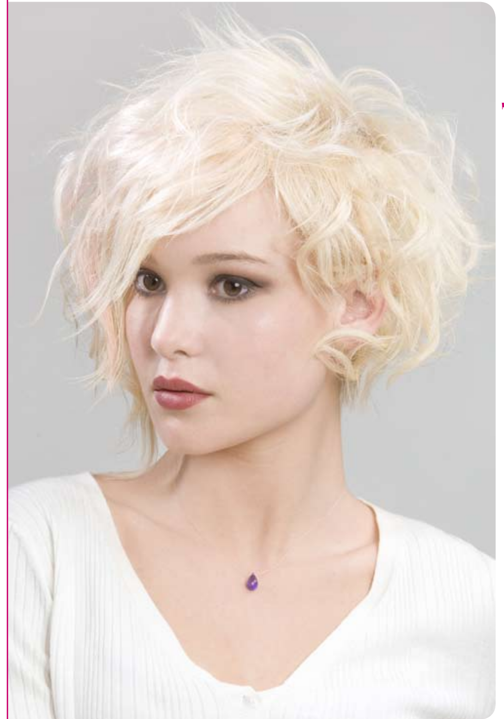
EAcademy by Jean-Marie Contreras - Nouvelle Marilyn, à la féminité gracieuse rehaussée d'un tatouage dans la nuque, et de mèches blond rosé...